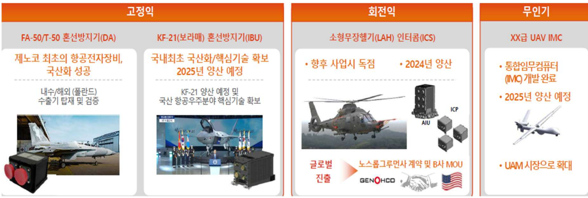
그림 1. 항공전자 제품 라인업