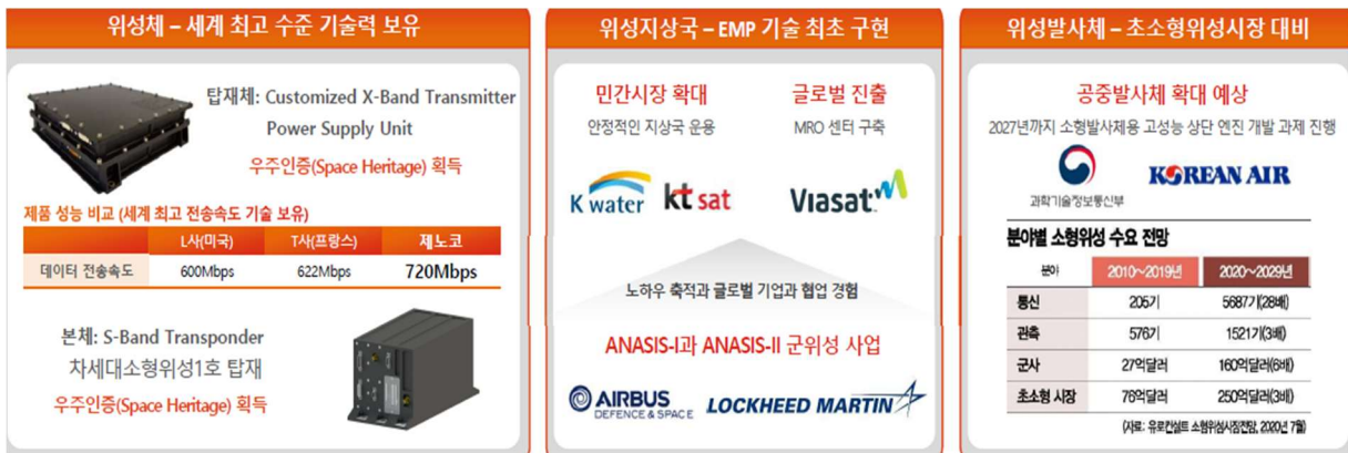
그림 3. 위성산업 라인업