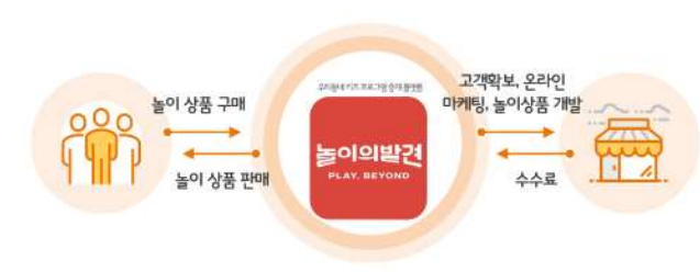
자료: 웅진씽크빅, 리딩투자증권 리서치센터