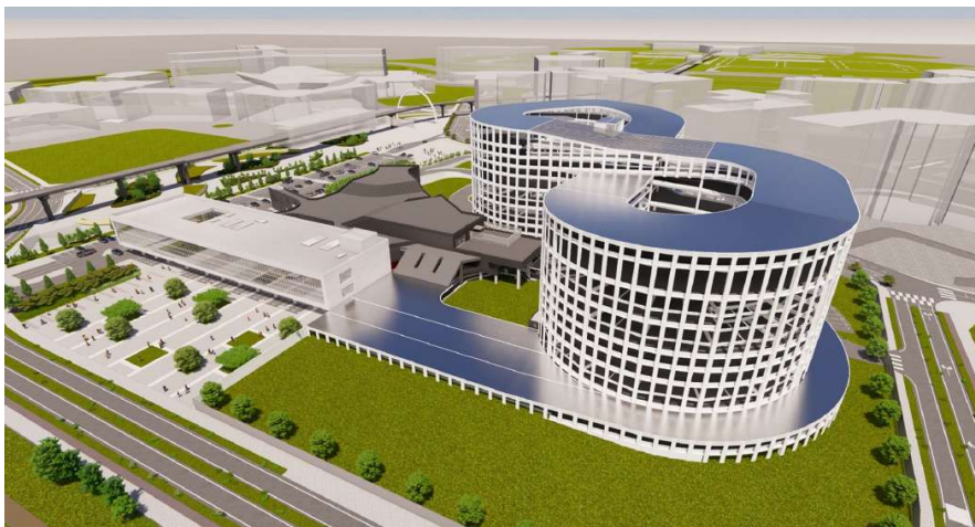
그림 3. '9.81 인천공항 제 1 터미널' 조감도