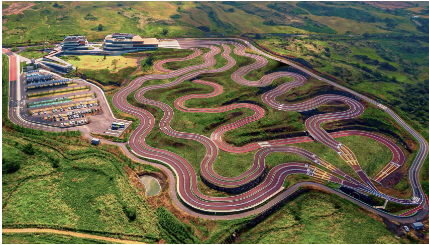
그림 1. '9.81 파크' 제주